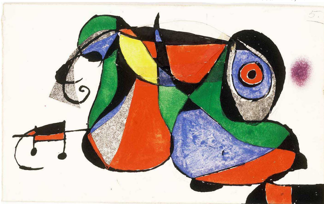
Maqueta per a Gaudí VI , 1975 [ca]

Gouache, tinta, llapis de grafit, pastel i collage sobre paper, 19,5 × 31,7 cm