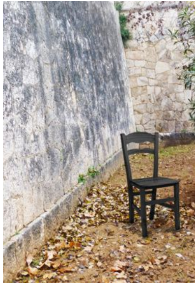
Recreació de la cadira de bronze que s'instal·larà al Mur de la Memòria