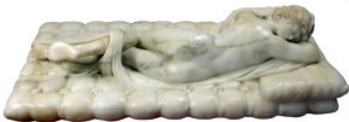
Hermafrodita Borghese. Copia del siglo XVIII de un taller romano.