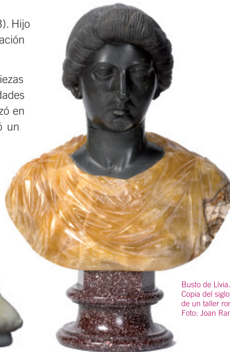
Busto de Livia. Copia del siglo XVIII de un taller romano.

El Museo de Historia de la Ciudad, aloja una parte importante de dicha colección, adquirida por el Ayuntamiento de Palma en 1923, gracias a la intervención de la Societat Arqueològica Lul·liana y de un grupo de intelectuales mallorquines.