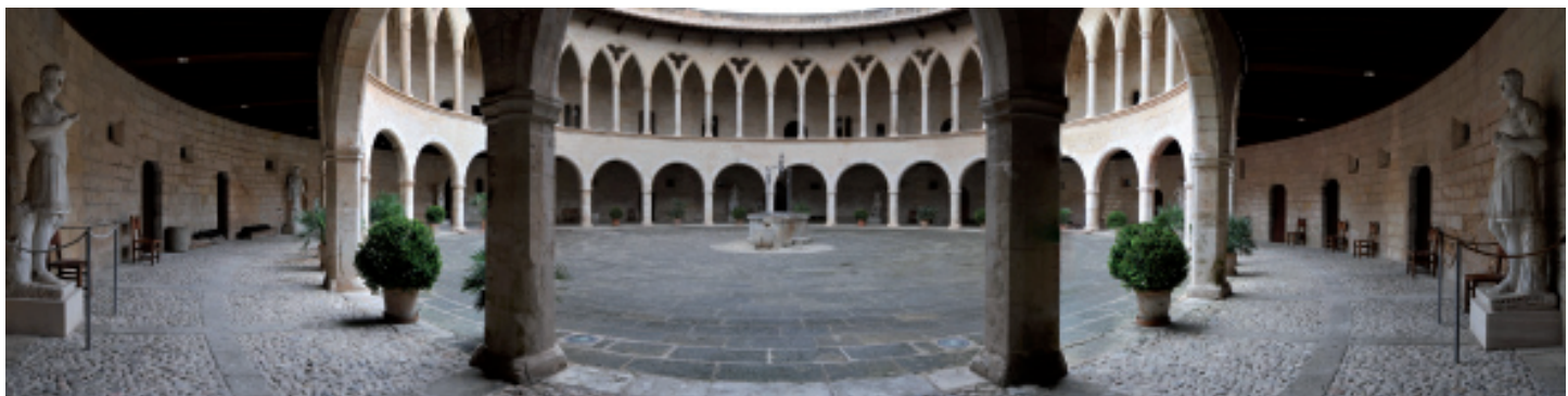
Patio de armas.