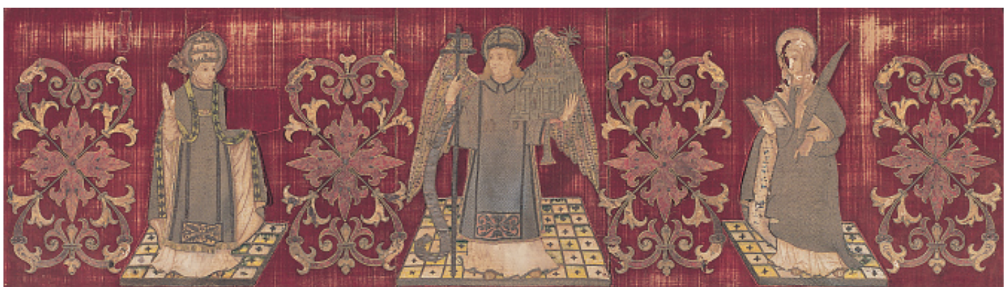
Frontal de altar de la capilla de San Marcos, c.1550.