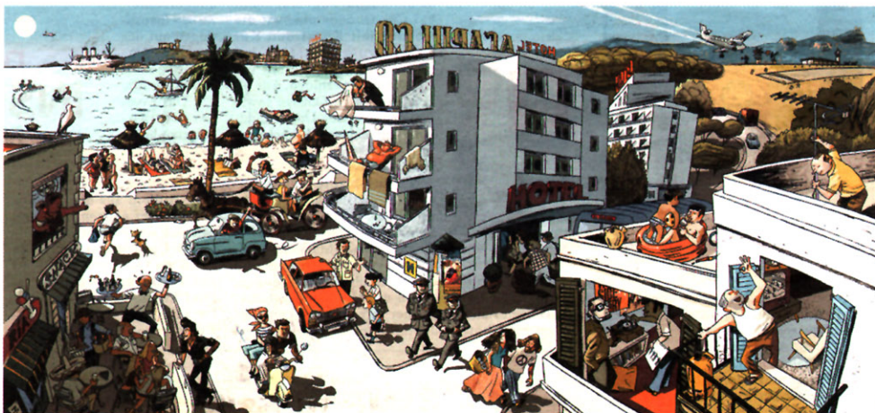
■ Aus einzelnen Zeichnungen am PC zusammengestellt: 's'Arenal in den 70ern aus der Sicht von Bartolomé Seguí.

„Interseccions“ war eine schwere Geburt: Seit fünf Jahren hat Rogé versucht, diese Retrospektive in den städtischen Ausstellungshallen