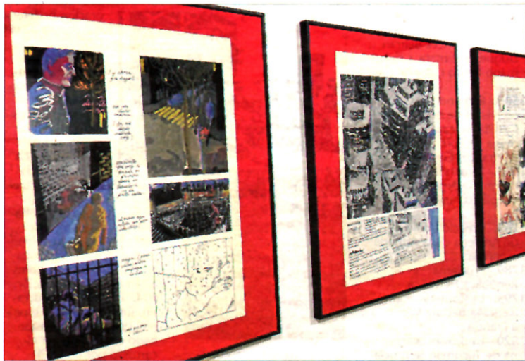
Algunas imágenes de sus colaboraciones en las revistas de los ochenta.

Còmic • Bartolomé Seguí recupera sus primeras ilustraciones, sus trabajos para las revistas de los ochenta y sus novelas gráficas más destacadas • La muestra, comisariada por Juan Roig, se inaugura hoy a las 19.00