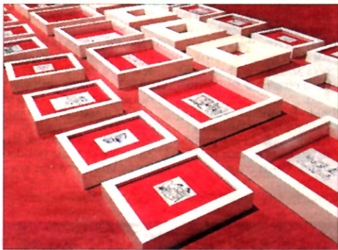
Pequeñas ilustraciones de Seguí para libros de texto.

o varios trabajos para El pequeño País . Interseccions resalta cómo el estilo de Seguí, colaborador de este periódico, se fue «adaptando» a las revistas de la época. «Me sorprendió